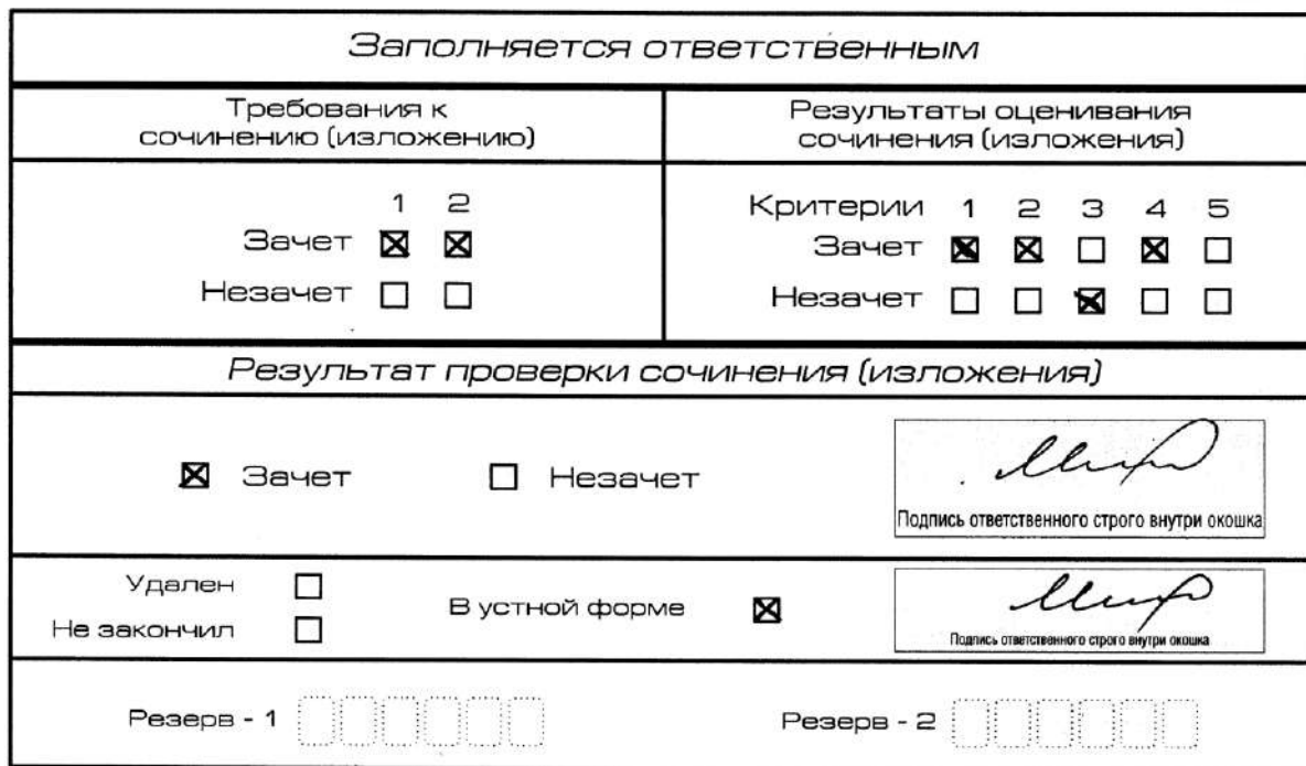
Рис. 11. Область для оценки работы сочинения (изложения) в устной форме

После окончания заполнения бланка регистрации ответственное лицо ставит свою подпись в специально отведенном для этого поле.