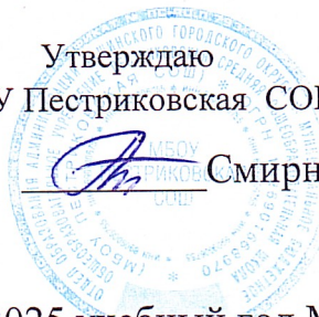
График общественно полезного труда на 2024-2025 учебный год МБОУ Пестриковская СОШ